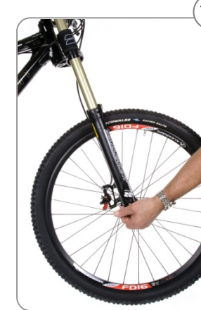
10 Vorderrad einbauen.