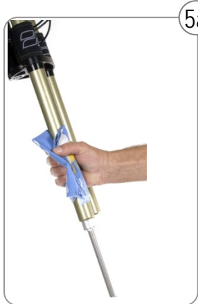
5a Casting und Standrohre ...