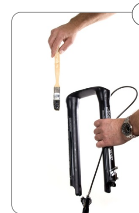
6 Beide Teflonlager im Casting und die Abstreifer mit ei- nem langen Pinsel mit BIONICON Neverstick-Fett einstreichen.