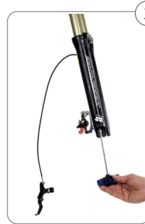
3 Schraube unten am Casting ab- schrauben, die Luft aus dem System muss nicht abge- lassen werden.