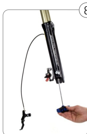
8 Von unten mit Casting-Schraube sichern (8 Nm).