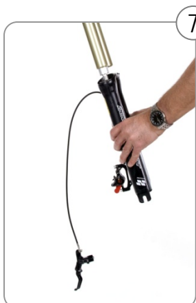
7 Casting wieder auf die Standrohre schieben.