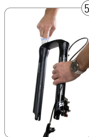
5c ...gründlich reinigen.