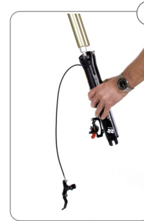
4 Casting nach unten abziehen.