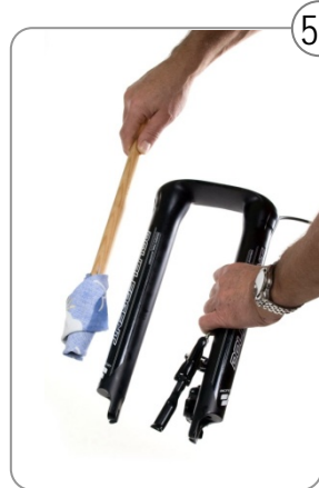
5b ...mit einem Lappen...