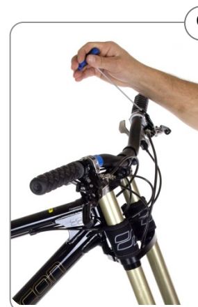
9 Bremshel an Lenker anschrauben.