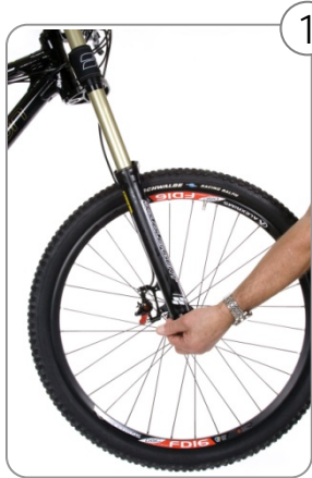
1 Vorderrad ausbauen.